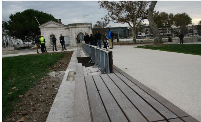
Astucieux et passionnant

Entre autres constructions et élévations, nous voyons de très près cette barrière amovible qui s'appuie sur la maison du YCC en passant sur les écluses