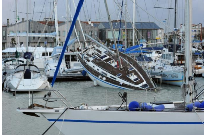
tempête qui envahit les quais et la vieille ville

14 h 00 Sur place, la Directrice des travaux de la ville vient vous expliquer la protection des ports de la baie après la fameuse tempête Xynthia l'aventure Du plan PAPI